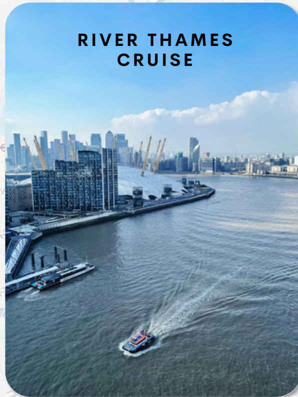
RIVER THAMES CRUISE